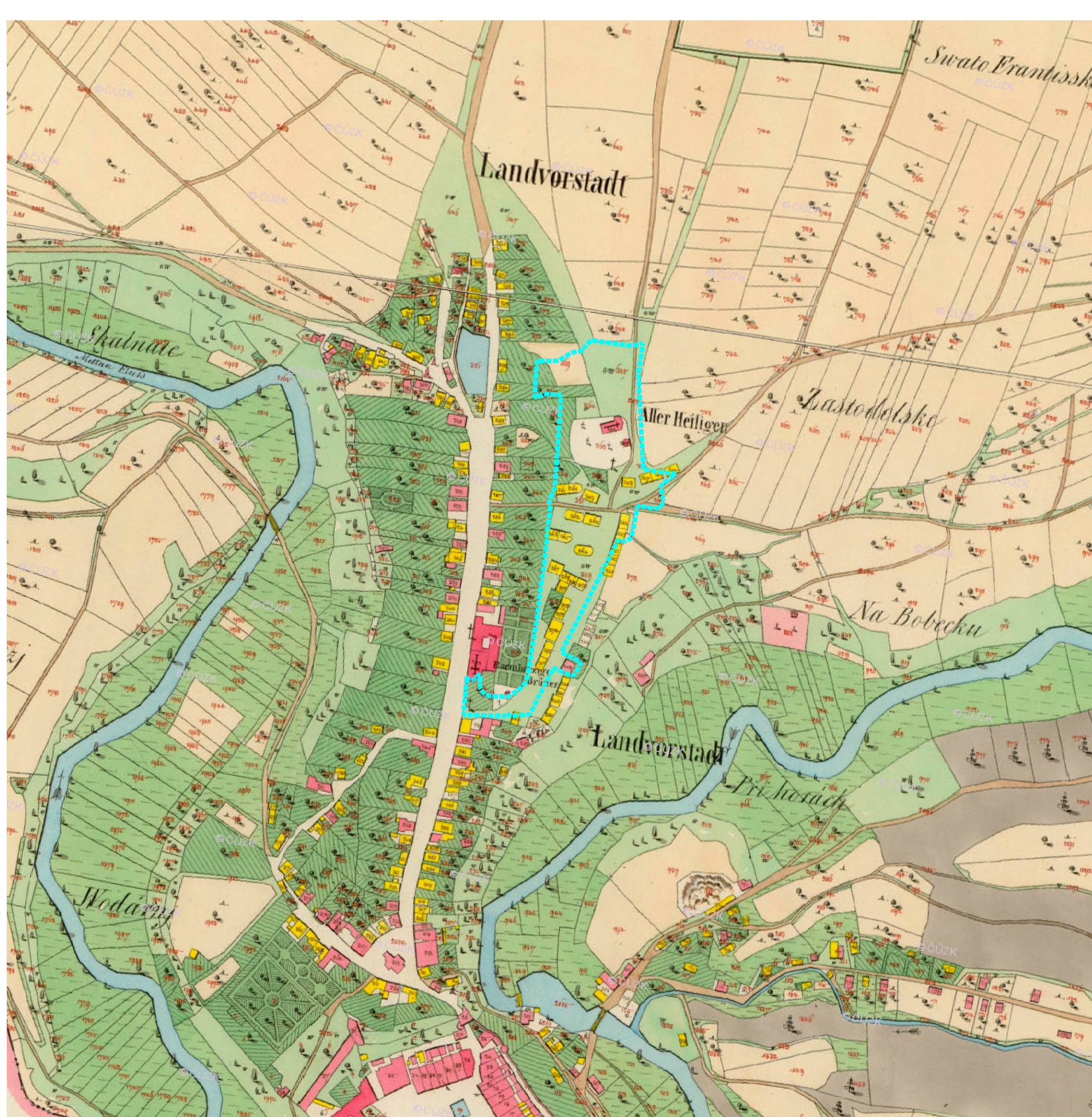
CIŠÁŘSKÝ OTISK STABILNÍHO KATASTRU - 1840 m 1:4000